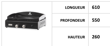
Annexe 1 : Appareil Plancha 2 feux