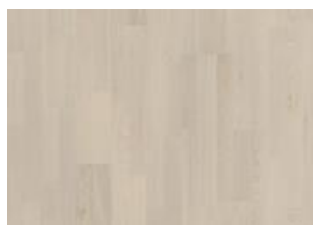
Coconut Cream 2-strip