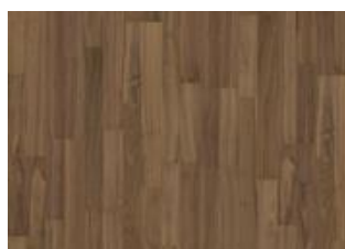
Pure Walnut 2-strip