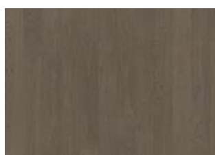
Faded Black Wide