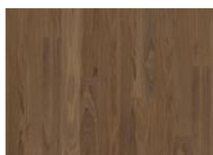
Pure Walnut Wide