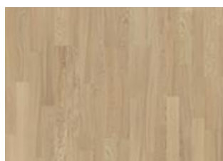
Whole Grain 2-strip