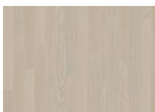
Coconut Cream Narrow