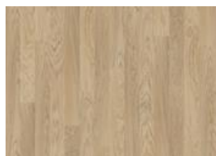
Whole Grain Narrow