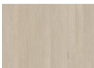
Coconut Cream Wide