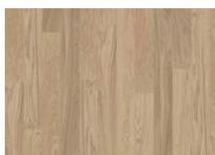
Whole Grain Wide