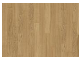
Pure Oak Narrow