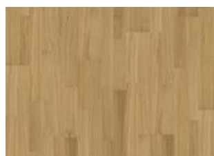
Pure Oak 2-strip